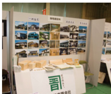
地元イベントでの使用例

展示会やイベントの間仕切りは、専門業者に依頼すると高価なモノになります。でも、簡易につくるには、運搬や組み付けなど以外とたいへんです。この「シキレール」は、アルミ製で軽くて、きれいで丈夫で長持ち、レールの組み合わせでどの方向にも連結できます。仕切り材も段ボールやプラ段、ベニヤなど用途に合わせて選べます。緊急時のプライバシー保護のための間仕切りなどにも利用できます。